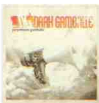
DARK GABELLE PERPETUUM GABELLE RedBlack, 2008