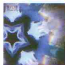
RISCH DRAWING SHAPES AND SPACES 4mg Records, 2008