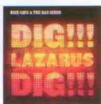
NICK CAVE & THE BAD SEEDS DIG!!! LAZARUS DIG!!! Emi/Mute Records, 2008

Najnovší album z dielne Nicka Cava a Bad Seeds pokračuje v línii ich doterajšej tvorby. Nejde o nič radikálne iné, ale zároveň sa nedá povedať, že by títo „páni v najlepších rokoch“ stagnovali. Pre Bad Seeds je typické spojenie inovácie a tradície. Pokiaľ boli ich posledné albumy ( Nocturama , Abbatoyr Blues/The Lyre of Orpheus ) viac meditatívne a plné melodických melancholických skladieb, tak na novej nahrávke sa obľúkom cez špeciálny projekt Grinderman opäť vracajú k drsnosti, neotesanosti a surovosti svojich starších nahrávok, ba dokonca k poetike (či možno lepšie ne-poetike) Birthday Party . Cez rôzne experimenty sa Bad Seeds dopracovali k vyváženosti medzi „nadupanými“ rytmickými skladbami garážového charakteru a citlivými „srdcervúcími“ baladami. Hudobníci nezostávajú len pri svojich tradičných nástrojoch, zvuk je obohatený o nástroje, ktoré vytvárajú zvukové prostredia a atmosféry výborne dopĺňajúce text, ktorý je veľmi dôležitý.