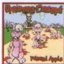
VENOMOUS CONCEPT POISONED APPLE Century Media, 2008